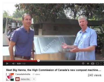
"Ambassaden har installerat Indiens första Big Hanna kompost på sitt område. Komposten omvandlar 18T matavfall per år till högkvalitativ kompost för att användas i Ambassadens trädgård. Grönsaker från trädgården kommer snart att användas i Ambassadens cafeteria."